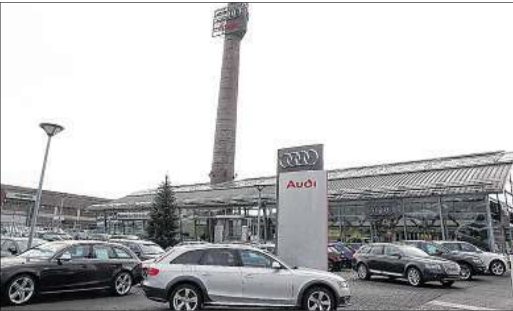
Auch bei Audi Borgmann wurde gefeiert. Zudem präsentierte das Autohaus Borgmann zahlreiche neue Modelle.

Doch beinahe mehr als die vergangenen 75 Jahre gilt bei Borgmann das Interesse der Zukunft. Wie reagiert man auf den ökologischen Wandel und auf die damit verbundenen veränderten Kundenwünsche? Das Autohaus Borgmann reagiert mit kompetenter Beratung. Diese führt zu einer Vielzahl von besonderen Serviceleistungen und natürlich äußerst attraktiven Jubiläumsangeboten. So bietet Borgmann den VW Transporter Kombi mit Platz für bis zu neun Personen zu konkurrenzlosen Preisen an. Für den VW Golf gibt es Toppreise und -Finanzierungskonditionen. Für den Audi A1 und Skoda hat Borgmann weitere Aktionsangebote geschnürt. Eine Entwicklung in der Automobilbranche hat Borgmann aktuell besonders im Blick: die Verschiebung der Ansprüche