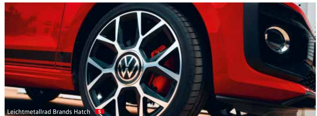
Leichtmetallrad Brands Hatch S

Die Abbildungen auf diesen Seiten können nur Anhaltspunkte sein. Die Druckfarben können die Sitzbezüge, Lackierungen und Räder nicht so wiedergeben, wie sie in Wirklichkeit sind. Serienausstattung S Seriausstattung GTI S Sonderausstattung SO