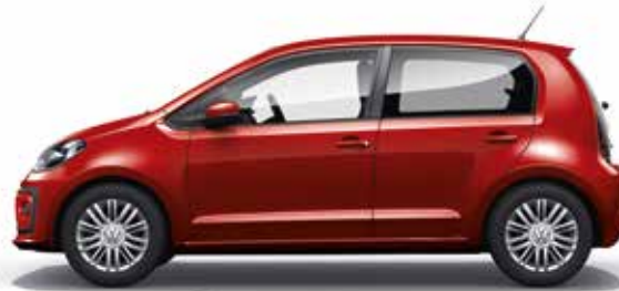
Kings Red Metallic-Lackierung P8 SO