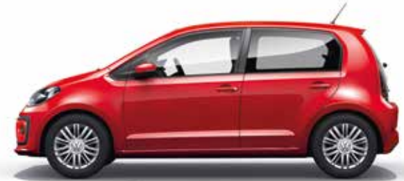
Red Uni-Lackierung G2 SO