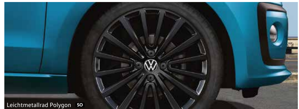
Leichtmetallrad Polygon SO