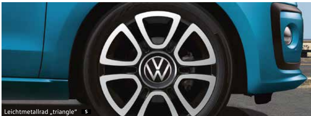
Leichtmetallrad „triangle“ S