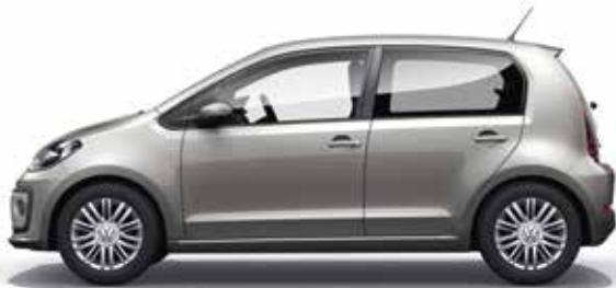
Dark Silver Metallic-Lackierung K5 SO