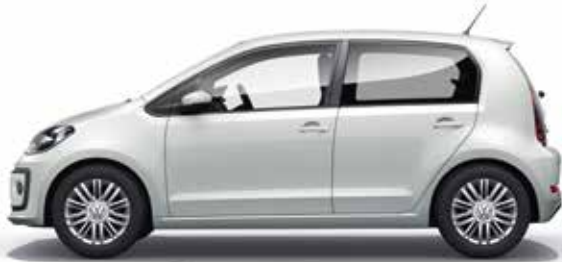
Pure White Uni-Lackierung 0Q SO