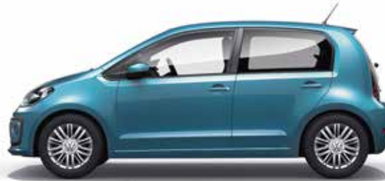
Teal Blue Uni-Lackierung B2 S