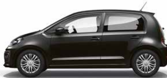
Black Pearl Perleffekt-Lackierung 2T SO