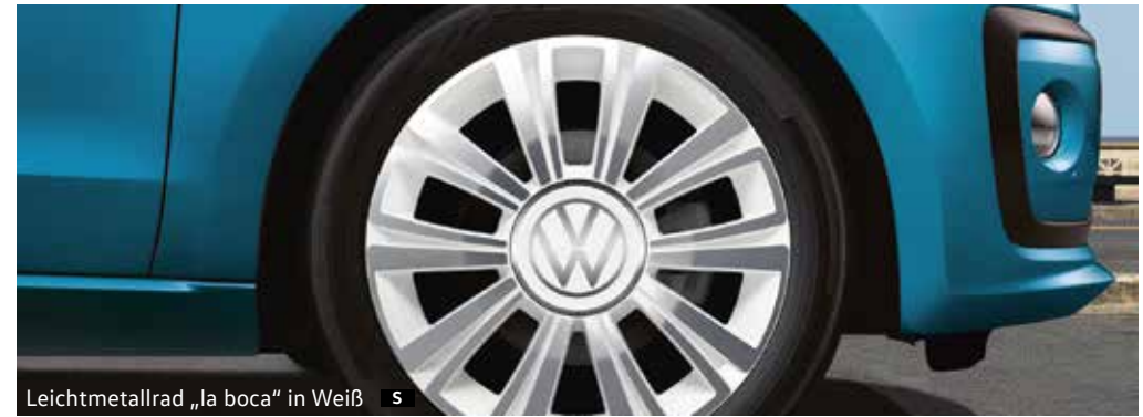
Leichtmetallrad „la boca“ in Weiß S