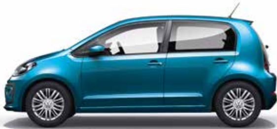
Costa Azul Metallic-Lackierung 3K SO