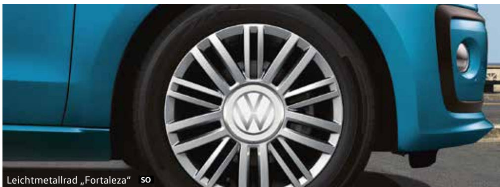
Leichtmetallrad „Fortaleza“ SO