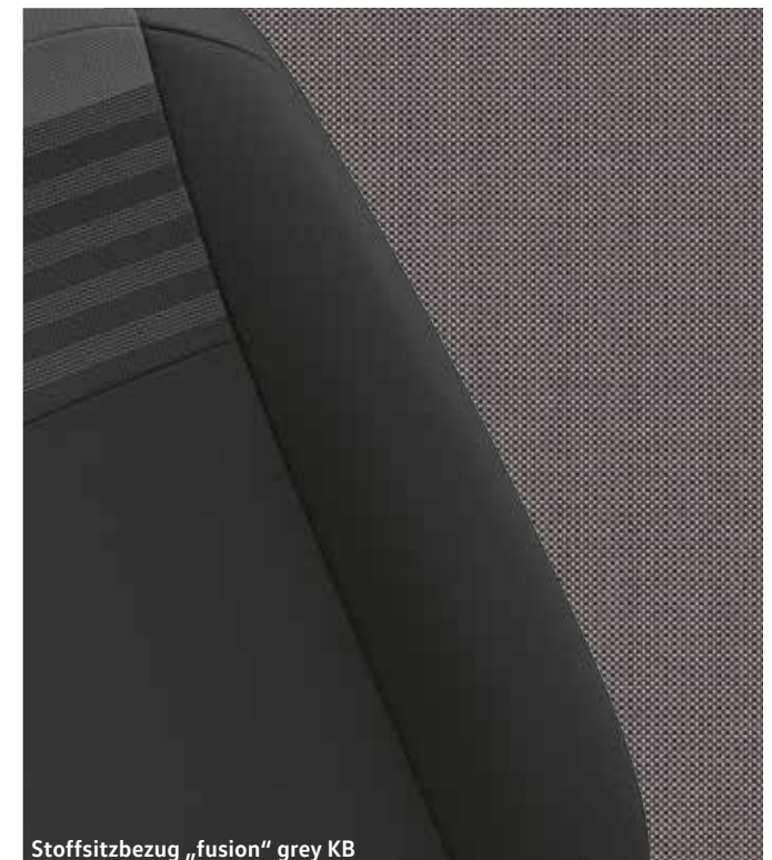
Stoffsitzbezug „fusion“ grey KB