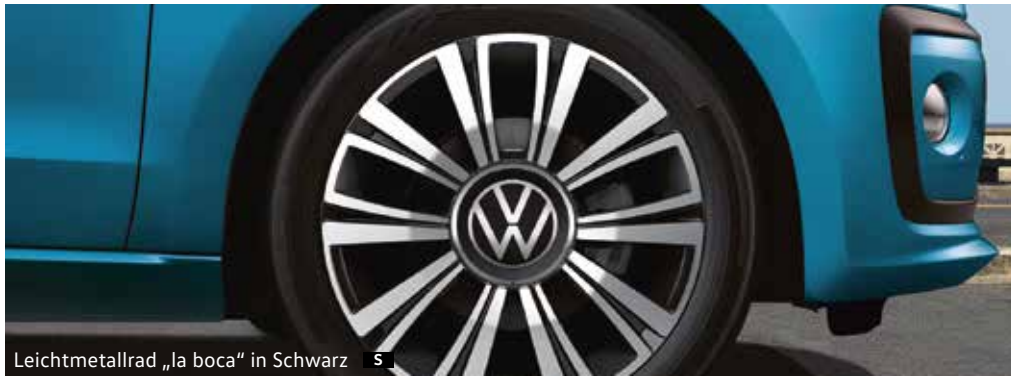
Leichtmetallrad „la boca“ in Schwarz S