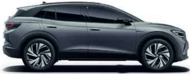
Mondsteingrau Uni-Lackierung C2