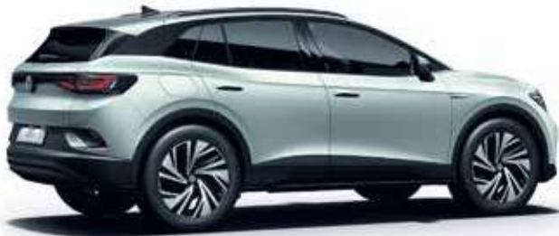
Scale Silver Metallic-Lackierung 1T