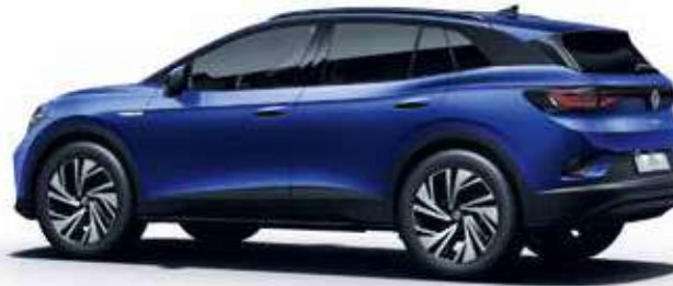
Blue Dusk Metallic-Lackierung 2P