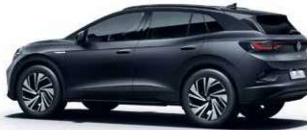
Mangangrau Metallic-Lackierung 5V