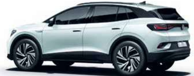
Gletscherweiß Metallic-Lackierung 2Y