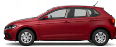
Kings Red Metallic