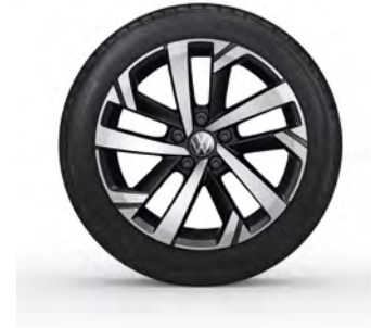
16-Zoll-Leichtmetallrad „Torsby“ 1 Optional für Polo Life