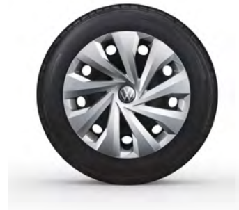
15-Zoll-Stahlrad 1 Serie in Polo Life