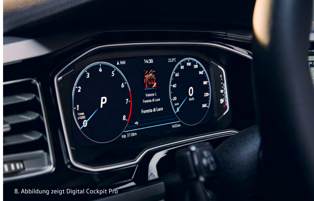
8. Abbildung zeigt Digital Cockpit Pro

8. Serie in Polo Style, optional erhältlich für Polo Life und Polo R-Line