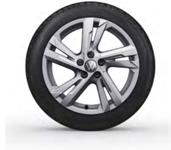
16-Zoll-Leichtmetallrad „Valencia“ 1 Serie in Polo R-Line