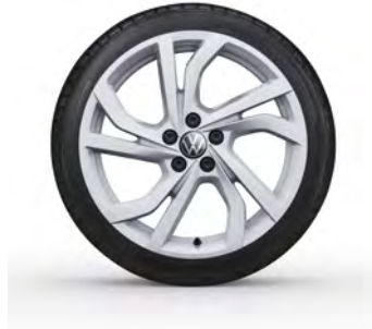
17-Zoll-Leichtmetallrad „Tortosa“ 1 Optional für Polo Style