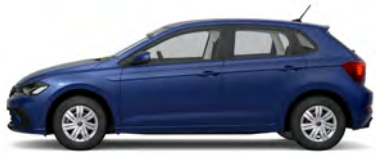
Reef Blue Metallic