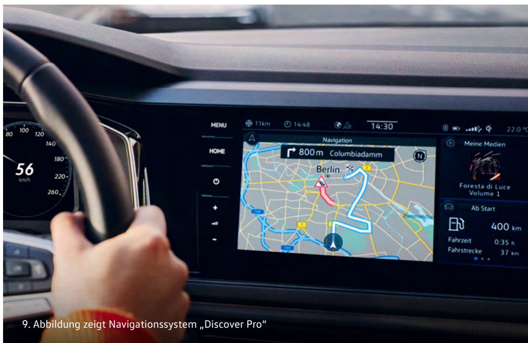
9. Abbildung zeigt Navigationssystem „Discover Pro“