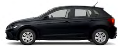
Deep Black Perleffekt