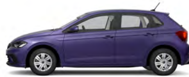
Vibrant Violet Metallic