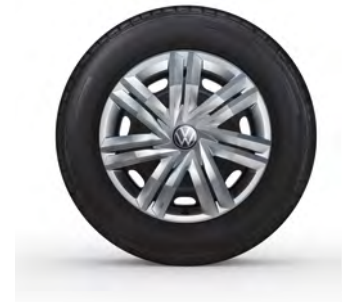
14-Zoll-Stahlrad 1 Serie in Polo