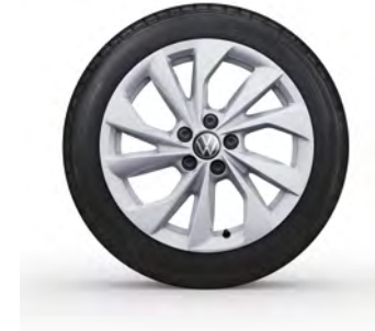
16-Zoll-Leichtmetallrad „Palermo“ 1 Optional für Polo Style