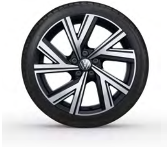
17-Zoll-Leichtmetallrad „Bergamo“ 1 Optional für Polo R-Line