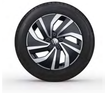
15-Zoll-Leichtmetallrad „Essex“ 1 Optional für Polo und Polo Life