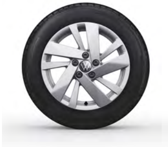
15-Zoll-Leichtmetallrad „Ronda“ 1 Serie in Polo Style